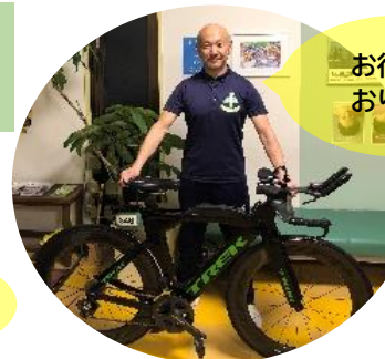
現 しんまちはり リハビリデイサービス